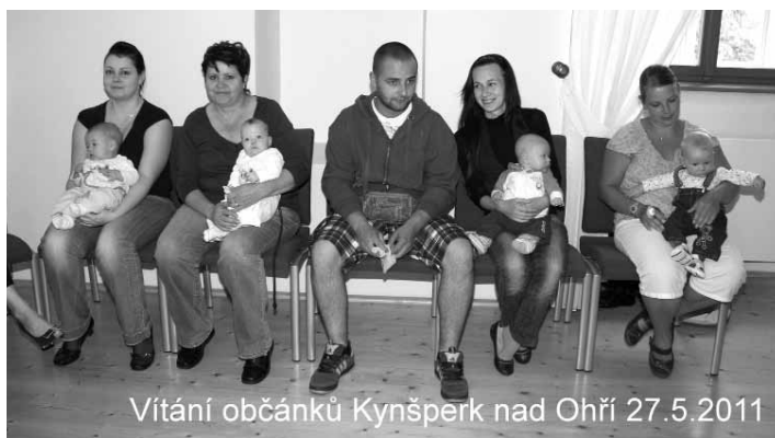
Vítání občánků Kynšperk nad Ohří 27.5.2011