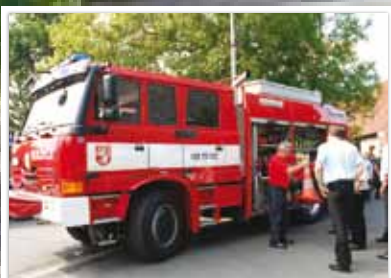
Utuzování vztahů se Kynšperku a Himmelkronu daří strana 2