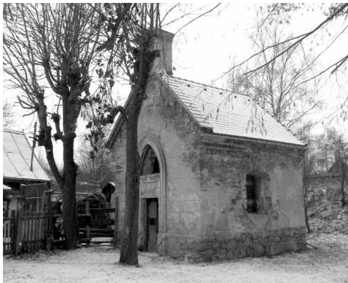
Kaple Kamenný Dvůr - Podlesí před rekonstrukcí...