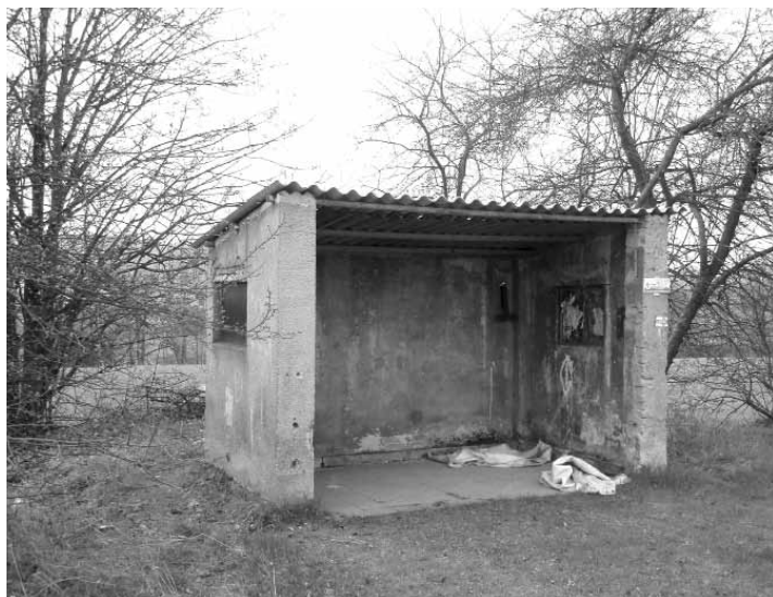
Před opravou zastávky MHD Zlatá...