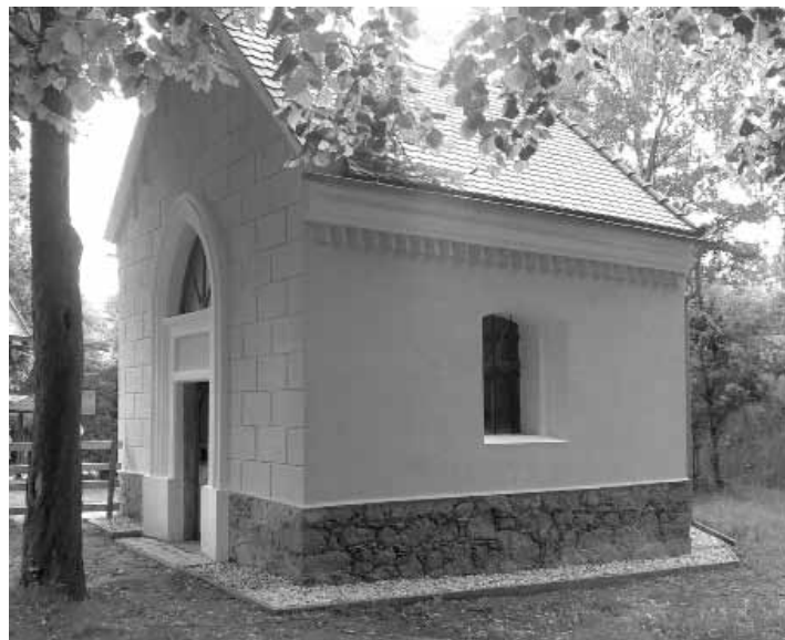
Kaple Kamenný Dvůr - Podlesí po rekonstrukci...