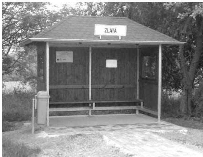
Po obnově zastávky MHD Zlatá...