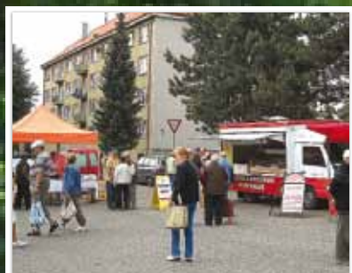
Farmářské trhy se vydaly, další se budou konat 8. července strana 6