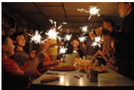
Str. 14 | Skauti