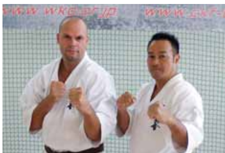
Str. 28 | Oddíl Gorin