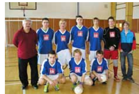
Družstvo chlapců po skončení futsalové divize