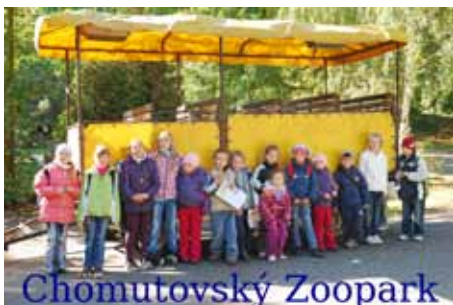
Str. 12 | Školní družina