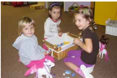
Str. 12 | Mateřská škola U Pivovaru