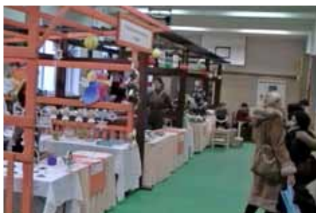
Str. 13 | Střední škola živnostenská