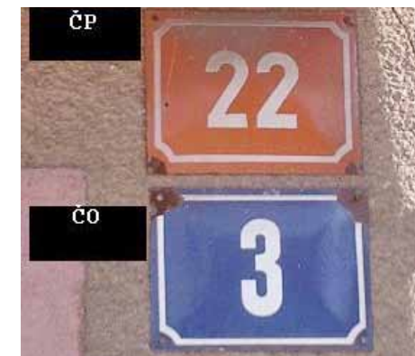
Obvyklé rozměry domovních cedulí

Vzor označení budovy číslem popisným a orientačním v Kynšperku nad Ohří