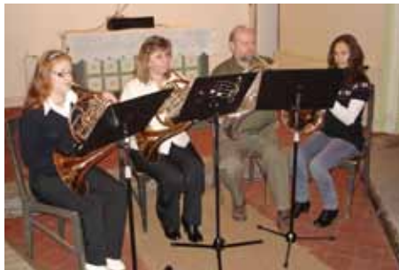
Str. 14 | Základní umělecká škola