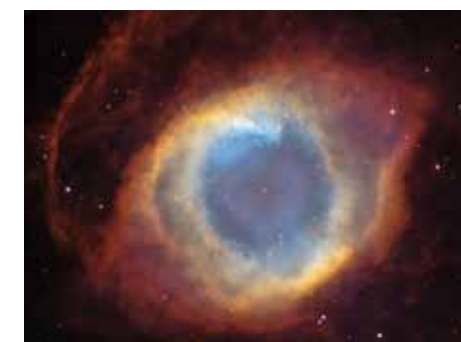
Mlhovina Magické oko – pozůstatek po výbuchu supernovy