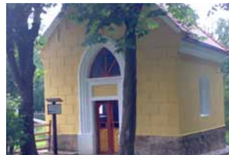
Stav kapličky po opravě