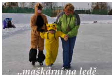
..maškarní na ledě