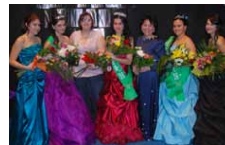
Dívka roku 2012