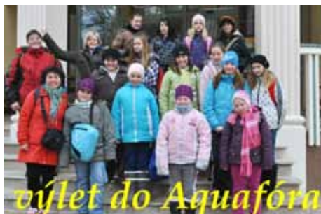
výlet do Aquafora