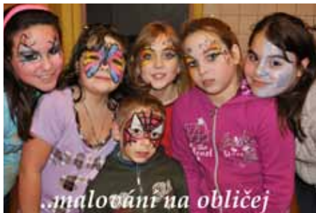
..malování na obličej