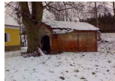
Bývalá požární stanice

Stavební úřad následně vydal souhlasné stanovisko k demolici. V průběhu února se uskutečnilo výběrové řízení na provedení demolice nebezpečné stavby, vyhrála Správa majetku s.r.o. Kynšperk s nejnižší nabídnutou cenou. Vlastní demolice bude probíhat ve dvou etapách. Nejpozději do 15. března 2012 bude dokončena vlastní demolice stavby, při které je nutné nebezpečný stavební odpad odvézt na řízenou skládku. Tyto práce bychom chtěli stihnout, dokud je dostatečně zamrzlý přístup k likvidovanému objektu, aby nedošlo k poškození okolních zelených ploch. V další etapě stavební dodavatel prostor po bývalé požární zbrojnici zaveze zeminou a oseje travním semenem. Následně město Kynšperk nad Ohří na nově vzniklém prostranství osadí dvě až tři lavičky a v rámci povinné výsadby dřevin za pokácené stromy nechá prostor osázet okrasnými dřevinami. Tím by zde měl vzniknout malý parčík s příjemným odpočinkovým místem pro cyklisty, turisty a návštěvníky města.