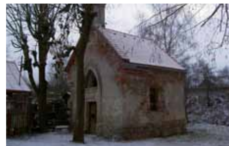
Stav kapličky před opravou

Majetkový odbor MěÚ Kynšperk nad Ohří v lednu vypracoval projektovou dokumentaci potřebnou k demolici chátrající a zdraví nebezpečné bývalé požární zbrojnice, která nemá žádnou historickou hodnotu.