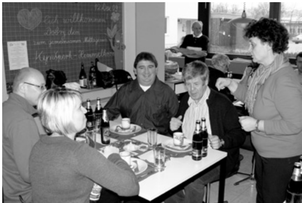
Účastníci partnerského setkání nakonec společně poobědvali.