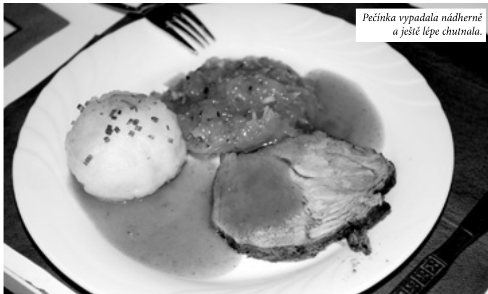
Pečínka vypadala nádherně a ještě lépe chutnala.

V sobotu 12. prosince se uskutečnila poslední společná akce našeho města s partnerským Himmelkronem v loňském roce. Místem konání byla tentokrát školní kuchyně v obci Neuenmarkt. Právě zde se totiž nachází společná budova vyššího stupně základní školy, sloužící žákům z několika okolních obcí, mezi nimiž jsou i himmelkronští. Touto akcí byl, jak jej nazvali němečtí přátelé, „kochkurz“ čili kurz vaření.