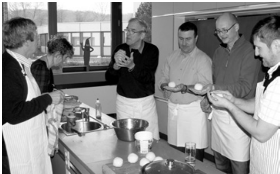
Koulení „klouzáků“ kynšperské radní zjevně bavilo.