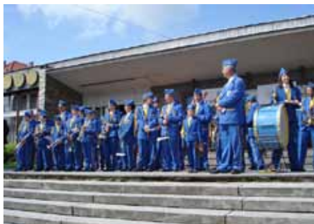
Orchestr Mariánské Lázně