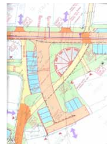
Část projektu Staré náměstí

poškozených kanalizačních šachet, které jsou důvodem propadání komunikací v jejich blízkosti. Firma VEOLIA s.r.o. Sokolov, jako správce, již provedla opravu šachet na místních komunikacích nám. SNP, ulic Bezručova a Strmá. Oprava ostatních poškozených kanalizačních šachet bude realizována podle volné kapacity správce vodohospodářského majetku.