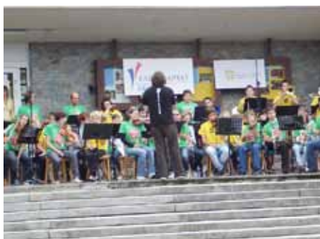
Taneční orchestr Tremolo z Třemošně