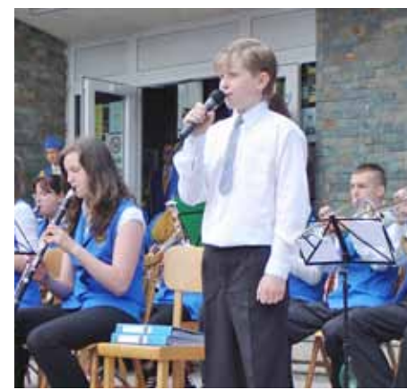
Zpěvák z Toužimi