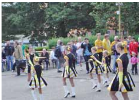
Majoret z Toužimi