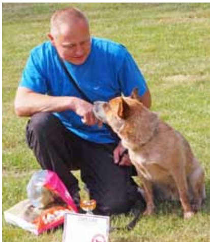
Armani 1.místo - v puppy

kontrolu během závodu. A tak se díky skupině milovníků chrtů a zejména pana Lyle Gillete v USA rozšířil lure-coursing – pokud možno co nejlepší napodobení lovu zajíce pomocí umělé návnady, navijáku a systému kladek. Tento sport je velmi oblíbeným v USA i většině zemích Evropy s delší historií chovu chrtů (Německo, Francie, Itálie, skandinávské země) a někde jej chovatelé vnímají jako aktivitu rovnocennou výstavám i klasickým dostihům, případně mají stejnou váhu jako zkoušky loveckých psů.