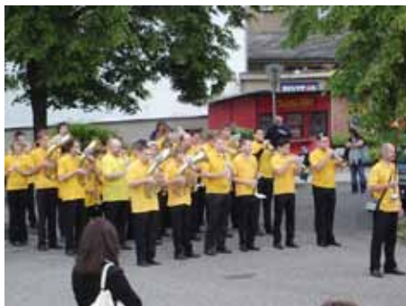
Orchestr z Tachova