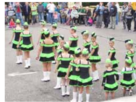
Majoret ZŠ Kynšperk