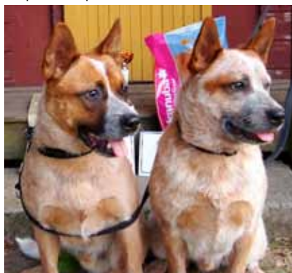
Armani 1. místo a Archie 3. místo - puppy

Původně vznikl lure-coursing jen pro chrtý, ti jsou pro něj nejlépe vybaveni, nicméně chuť lovit střapeček mají psi prakticky všech plemen a v České republice se mohou všichni coursingu účastnit. Nejsou sice tak rychlí jako chrti, ale často běhají velice dobře a s maximálním nasazením. Proto je velká spousta majitelů psů, kteří si coursing oblíbili, psy velmi baví a hlavně unaví a většinou se koná v přírodě v pěkném prostředí