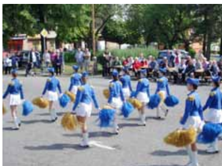
Orchestr M. Lázně s majoret