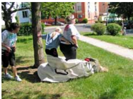
Kobra 11 v pytli

V sobotu 26. května již od rána vykukovalo sluníčko a předznamenalo nádherné počasí pro již tradiční akci v ulicích Kynšperku a na silnicích našeho i okolních okresů. Ano, opět se jel Botas ( Branně Orientační Turistická Automobilová Soutěž ), tentokrát jubilejní a neuvěřitelný 30. ročník.