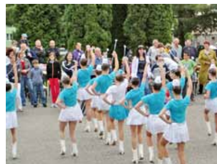
Majoret ZŠ Kynšperk