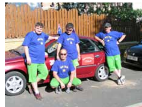
Vítězná posádka - Skleník