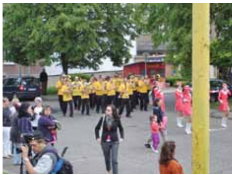
Orchestr z Tachova + majoretky