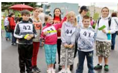
Dopravní soutěž mladých cyklistů