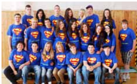
9. B základní škola