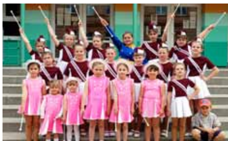
Mažoretky - sluníčko