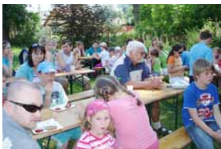
Zábavné odpoledne 2011

Srdečně Vás zveme na červnové akce Základní umělecké školy.