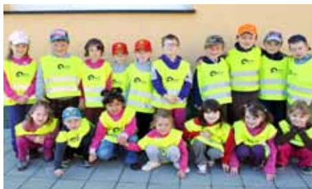
Mateřská škola (Školní ulice)