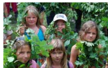
maskování v lese