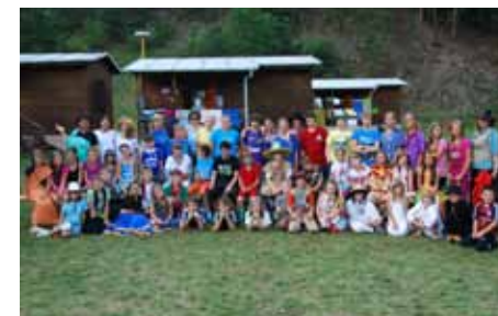
karneval v Rio