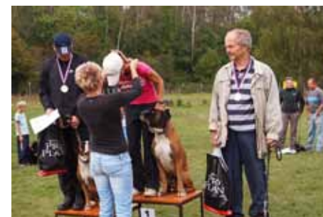
Kategorie dospělý pes