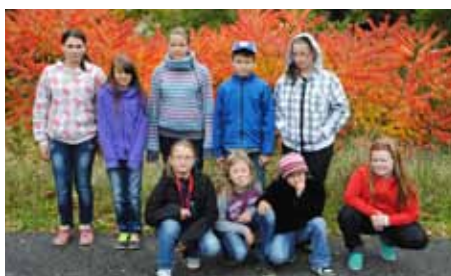
ZK - fotokroužek