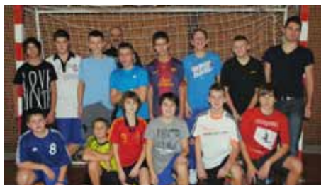
ZK - žáci