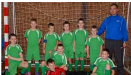
kopaná - mladší příprava