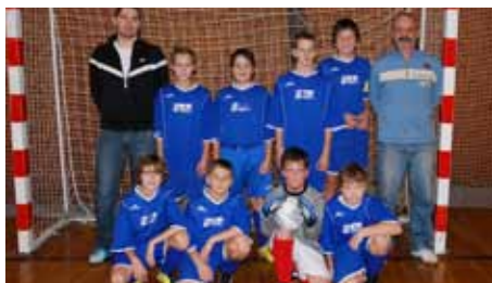
kopaná - mladší žáci