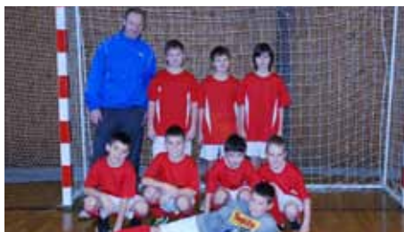
kopaná - starší příprava