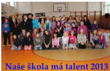
Naše škola má talent 2013