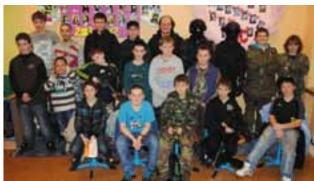
ZK - airsoft