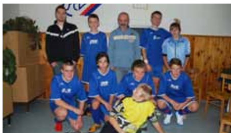
kopaná - starší žáci